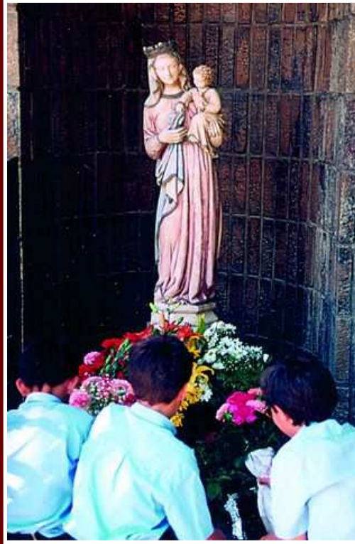
El mes de mayo

Con el mes de mayo llegaba el olor a césped recién cortado y el sabor a flash de quince pesetas. Era el mes en el que sacábamos los pantalones cortos del armario, metíamos los jerseys y nos preparábamos para el último tramo del curso. Probablemente fuera el mes más esperado: empezaba a hacer buen tiempo, el día alargaba sus horas y ya veíamos cerca el fin de curso, aunque todavía no teníamos la presión de los exámenes de junio.