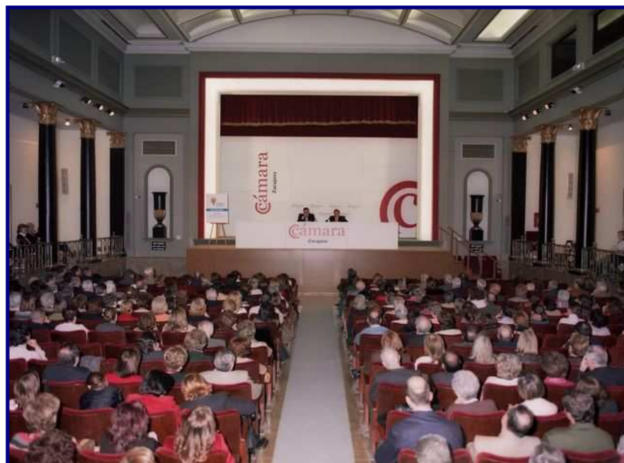
Panorámica general de la sala durante la presentación de Proliena

El acto finalizó con un interesante coloquio.