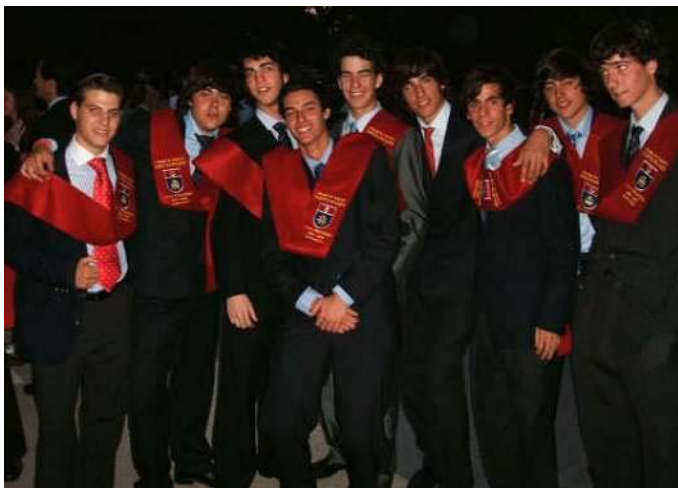
Un grupo de la promoción, después de recibir la beca del Colegio