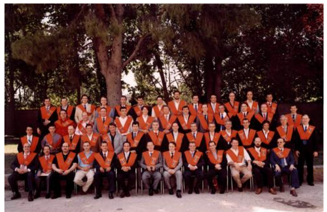
Foto de grupo de todos los participantes en la Jornada

Después nos dirigimos hasta el Club Social El Tiro de Pichón, donde se sirvió una cena y, para finalizar, se hizo entrega al presidente de la Comisión Organizadora de unos gemelos de oro con el escudo del Colegio, en reconocimiento a su importantísima labor sin la cual hubiera sido muy difícil organizar todos los actos.