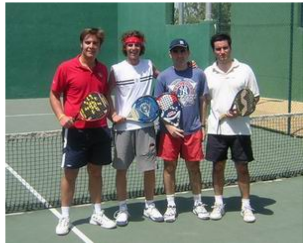
La pareja ganadora y la finalista

Por suerte, tras el éxito cosechado y ante la cascada de peticiones, parece que pronto podremos hablar del II Torneo de Pádel de Antiguos Alumnos en el que esperamos aumentar la participación.