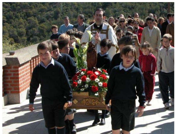
Un grupo de alumnos de 3º llevan en procesión a la Virgen

Por la tarde, se fueron turnando para llevar a la Virgen en procesión por la explanada del Santuario. Una talla adaptada a su edad, claro, aunque no deja de advertirse el esfuerzo de los peregrinos.