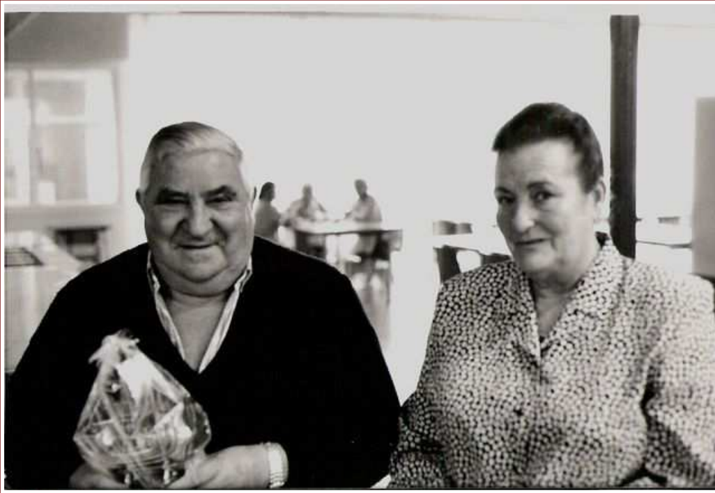
El señor Santiago

El señor Santiago es un lugar común al que muchos hemos regresado con cierta frecuencia a lo largo de los años.