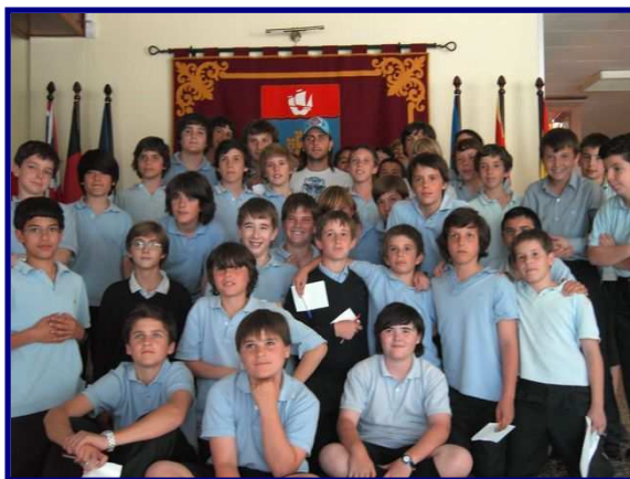
En la imagen de la izquierda, 1º de ESO posa junto con Sergio García, jugador del Real Zaragoza, en una visita que realizó al Colegio. A la derecha, un grupo de 5º de Primaria instantes antes de empezar la representación teatral de final de curso